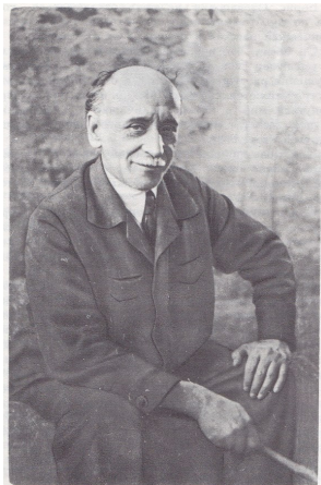
Б. С. Житков в 30-е годы.

Родился Борис Степанович Житков в Новгороде 30 августа 1882 года. Отец его преподавал математику, мать была пианисткой. Худенький, узкоплечий, небольшого роста Борис был четвёртым ребёнком в семье, но имел гордый и твёрдый характер. Один раз сёстры решили подшутить над ним. За обедом они насыпали Боре в тарелку соли. Чуть ли не целую солонку! Борис как всегда немножко посолил суп, попробовал... Девчонки еле сдерживали смех, а Борис, как ни в чём не бывало, почемокал губами, ещё немного посолил и стал есть. Съел пересоленный суп и вида не подал. Вот какой характер!