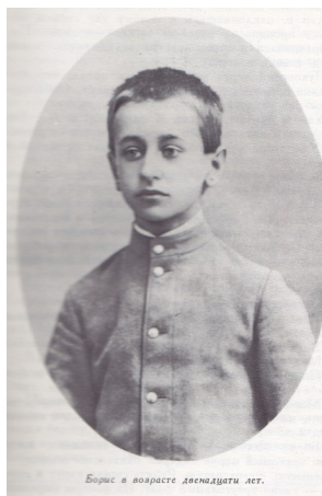
Борис в возрасте двенадцати лет.

Родился Борис Степанович Житков в Новгороде 30 августа 1882 года. Отец его преподавал математику, мать была пианисткой. Худенький, узкоплечий, небольшого роста Борис был четвёртым ребёнком в семье, но имел гордый и твёрдый характер. Один раз сёстры решили подшутить над ним. За обедом они насыпали Боре в тарелку соли. Чуть ли не целую солонку! Борис как всегда немножко посолил суп, попробовал... Девчонки еле сдерживали смех, а Борис, как ни в чём не бывало, почемокал губами, ещё немного посолил и стал есть. Съел пересоленный суп и вида не подал. Вот какой характер!